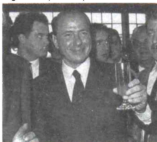
di Fra Diavolo

soluz.: il rebus con Berlusconi (da "La Sibilla" 1/1994)