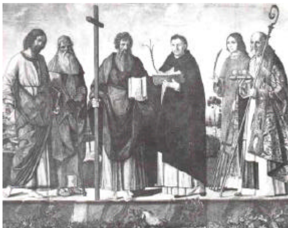
di Fra Diavolo

soluz.: sei glorie religiose (da "Aenigma" 4/1972)